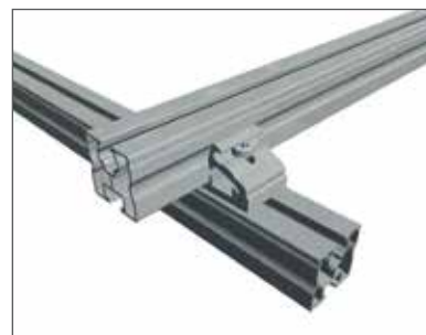
3 Poser le profilé au-dessus et visser par le haut.

Le connecteur en croix Rapid (Art. N° 129063-000) est complètement pré-assemblé contrairement à son prédécesseur. Ainsi, les étapes de montage sont réduites à un minimum.