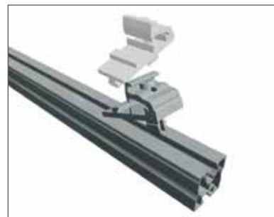
1 Accrocher latéralement et tourner.