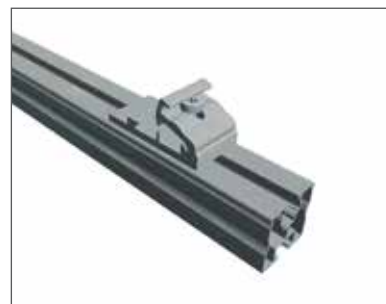
2 Encliqueter !